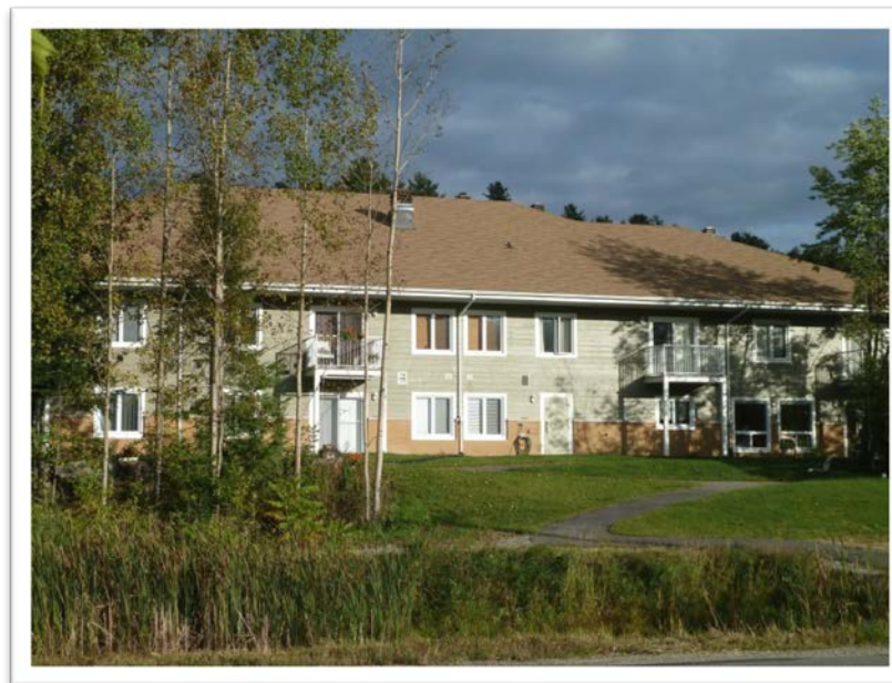
ce qu'il pourrait ressembler

La résidence des aînés prévue comporte un total de 12 logements d'une et deux chambres à coucher dans un bâtiment de deux étages. Alors que les logements seront adaptés aux besoins de personnes âgées autonomes, et qu'ils offriront cuisines et salles de lavage, le bâtiment disposera d'une salle commune qui permettra d'offrir des activités et repas communautaires aux résidents. La résidence dispose d'un stationnement et d'un patio/jardin qui répondra aux besoins des résidents. Alors que la phase initiale du projet procède de bon train, et que le projet bénéficie d'un plein appui de la Municipalité de Chelsea, le projet est présentement en attente de financement de la Société d'habitation du Québec.