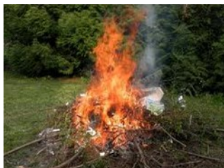
Feu à ciel ouvert de plus d'un mètre et de moins de 4 mètres avec permis du 1 er nov. au 30 avril seulement