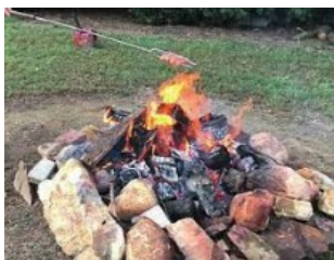
Feu à ciel ouvert autorisé sans permis annuellement tout en respectant certaines conditions, maximum d'un mètre

En 2022, 48 permis de brûlage et 10 permis de feux d'artifices furent délivrés , lesdits permis sont disponibles à la caserne 1, sise au 7 chemin Hôtel-de-Ville ou par courriel à incendie@chelsea.ca .