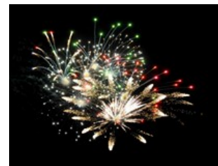
Feu d'artifice – obtention au préalable d'un permis et l'autorisation du SSI